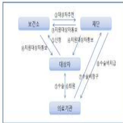
[노인 무릎인공관절수술 지원 사업 실시체계]